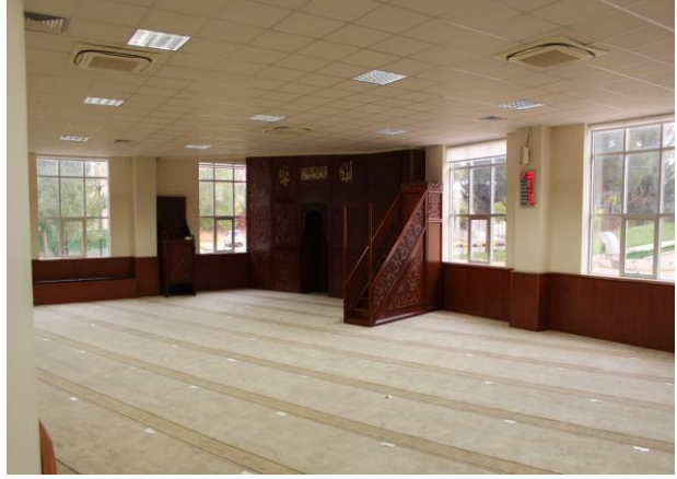
Şekil- 2) 250 Kişilik Konferans Salonumuz ve 270 Kişilik Mescidimizden bir görüntü