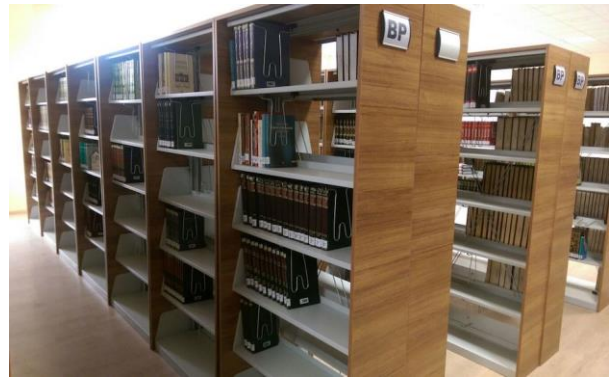
Şekil- 1) Kütüphanemizden Görüntüler