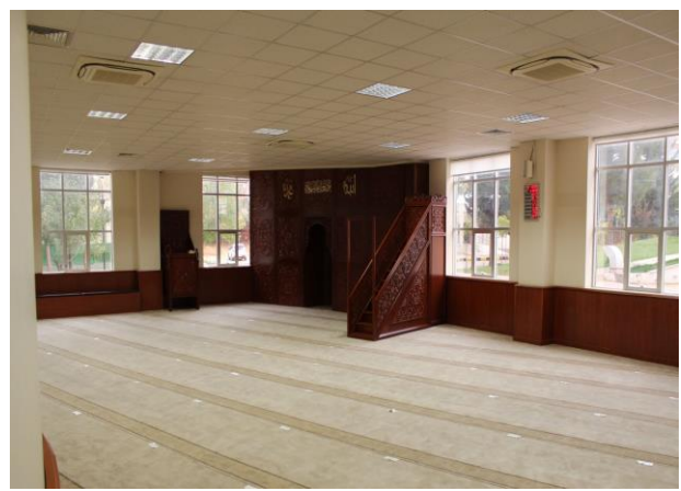
Şekil- 2) 250 Kişilik Konferans Salonumuz ve 270 Kişilik Mescidimizden bir görüntü